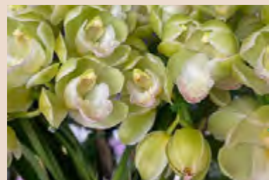
近年人気のテーブルシンビジウム「雪月花」