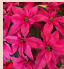
「思いやり」の花言葉のプリンセチア