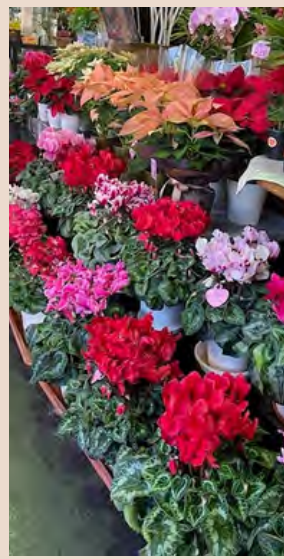
シクラメンは赤が人気!!