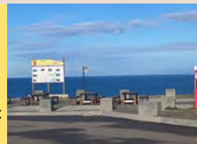
60キロ先には奥尻島が見える