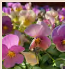
色が変化するビオラ「ななちゃん」