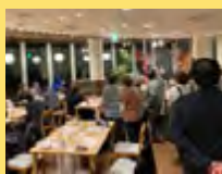
場内からは大きな拍手と歓声が