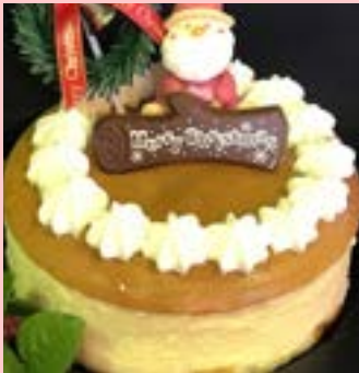
ジョリーアンジュ今年の新作 ふわふわチーズの スフレチーズデコレーション

尚、年内は26日(火)より休業させていただきます。テイクアウトのみ対応いたします。