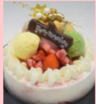
毎年大人気! 5種の人気ジェラートとイチゴ果肉のせ アイスデコレーションケーキ