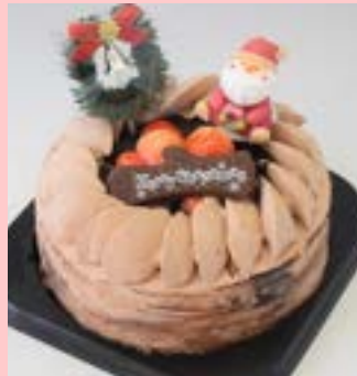
昨年大人気!更に濃厚 生チョコクリスマス デコレーションケーキ