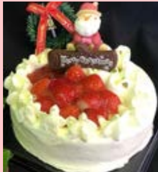
クリスマスの定番 搾りたて生クリームたっぷり 生クリームデコレーションケーキ