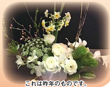
これは昨年のものです。

TEL 0269-23-2380 E-mail hanaippai1187@gmail.com